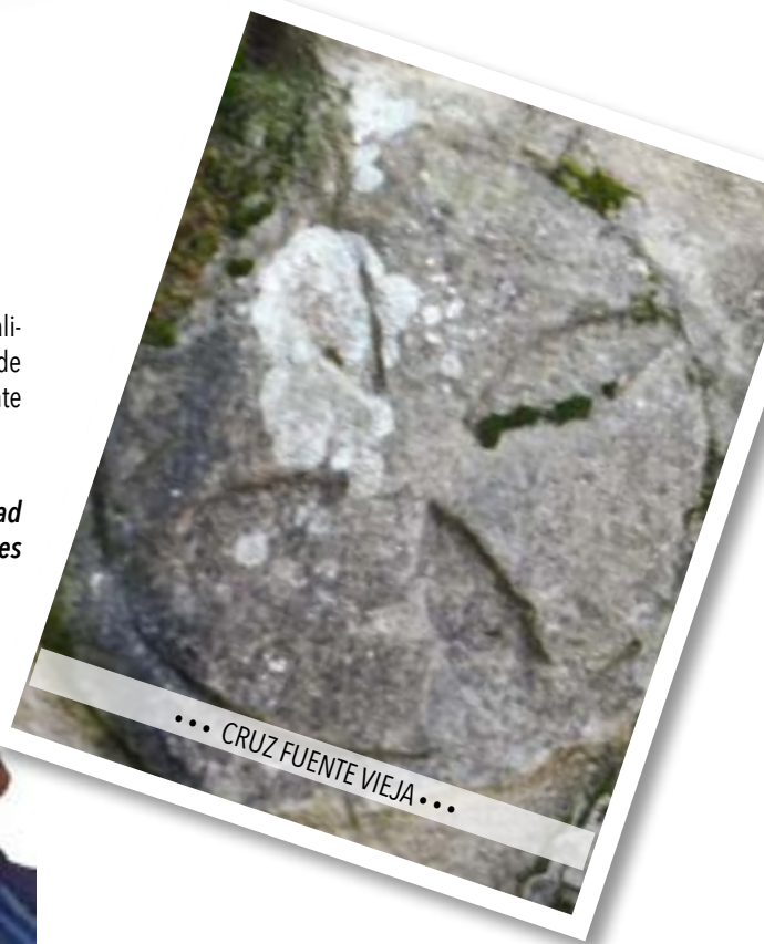
... CRUZ FUENTE VIEJA ...